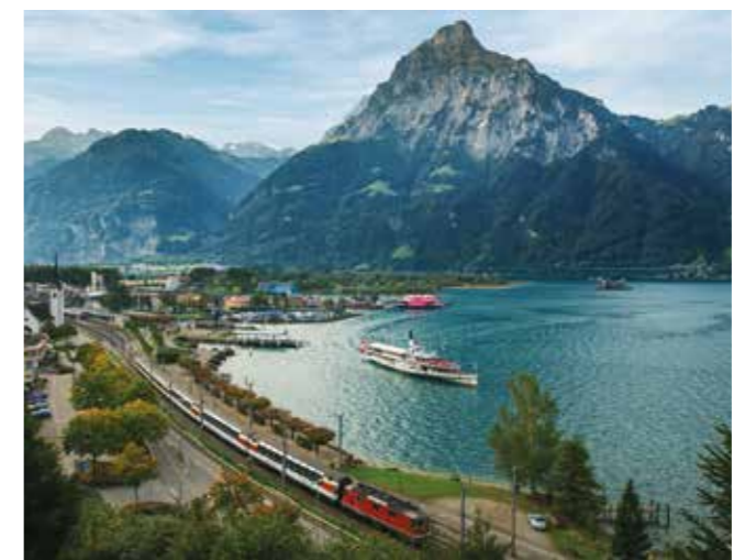
Gotthard Panorama Express / Suiza