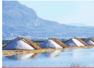
ruta del sal